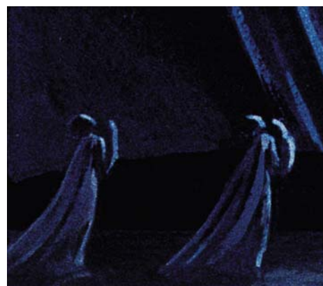
Detalle boceto de Josef Svoboda