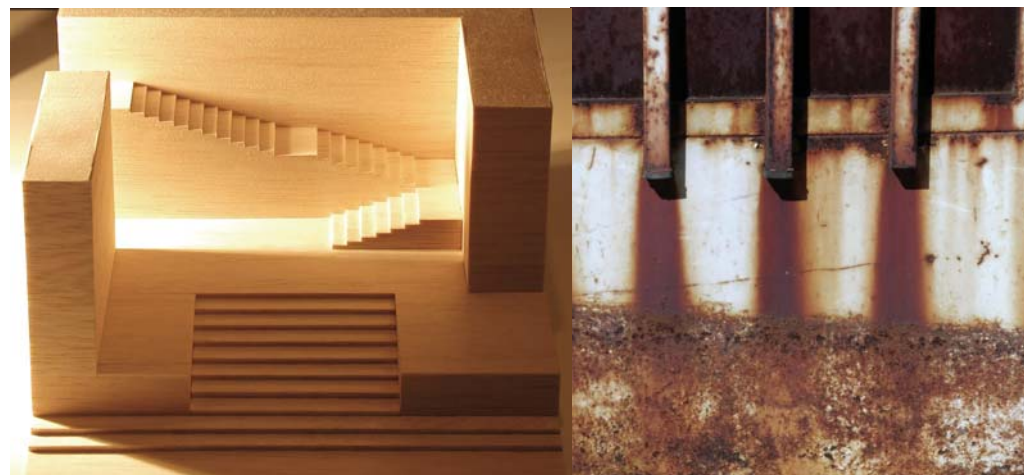
Maqueta de Picado de Blas Arquitectos sobre un original de A. Appia

Analizando los cambios fundamentales del mundo escenográfico teatral y las arquitecturas efímeras de nuestro tiempo, aplicando técnicas constructivas y recursos expresivos escenográficos (nuevos lenguajes técnicos con luz, imagen, sonido...), y utilizando medios gráficos y digitales de comunicación, se definirán espacios expositivos, proyectos escenográficos y arquitecturas efímeras.