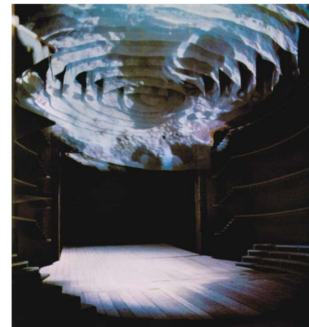
Escenografía de Josef Svoboda