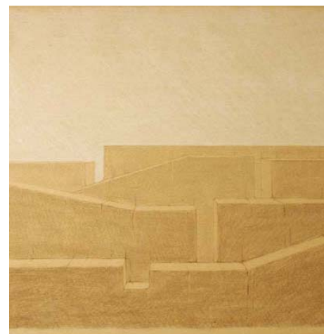
Boceto de Adolphe Appia