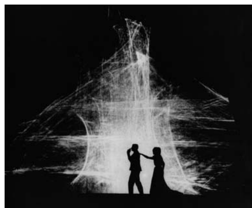
Escenografía de Josef Svoboda