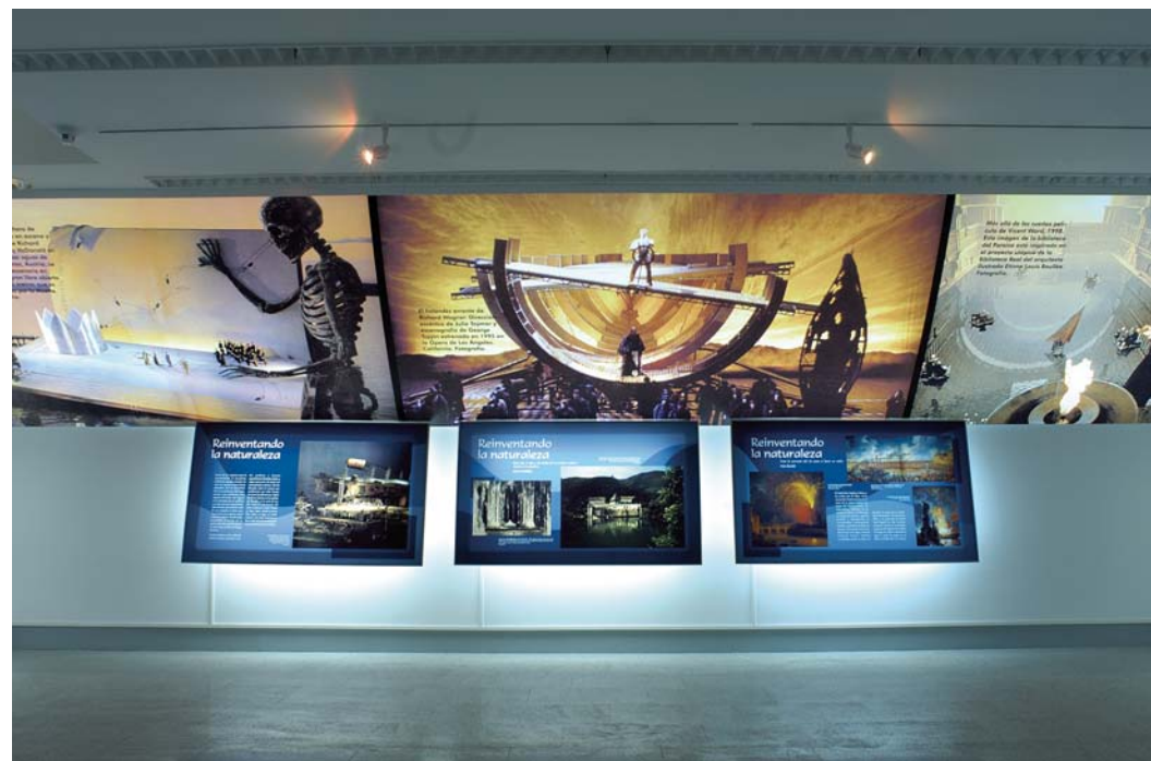
Diseño de ideograma para la Fundación Canal